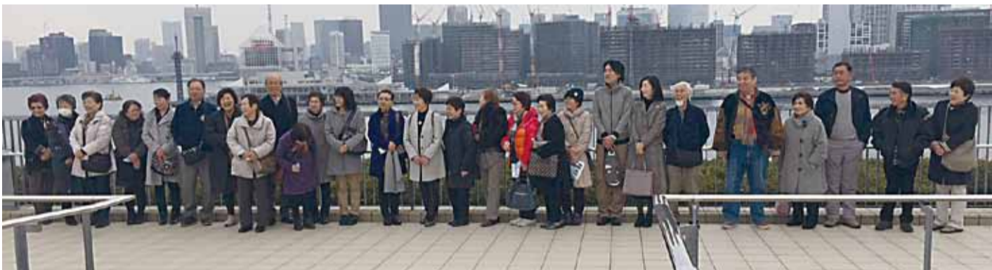
日帰り研修会に参加のみなさん (背景は建設中の2020東京オリンピック選手村です!)

当日は飲食店と専門店が集まる水産仲卸棟をメインに、「魚がし横丁」でお店の人と会話しながら充実した視察研修ができました。